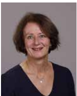
Karien van Bijsterveldt