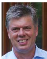
Marcel van Miert